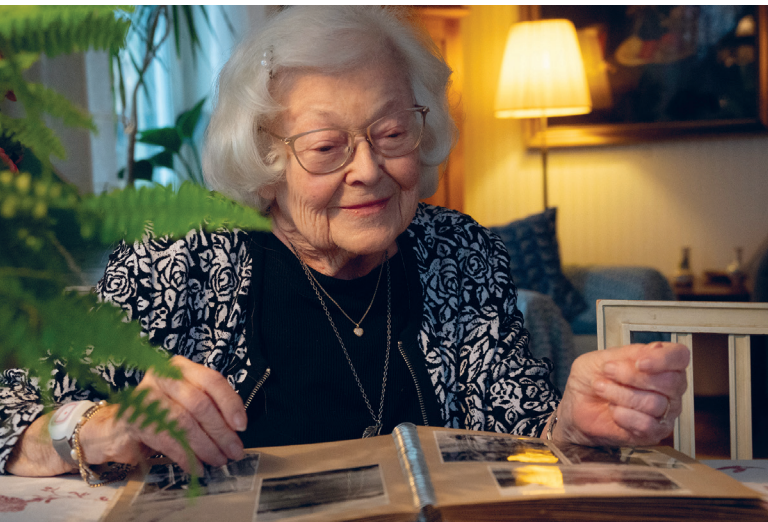
Birgitta tittar i sina gamla fotoalbum.