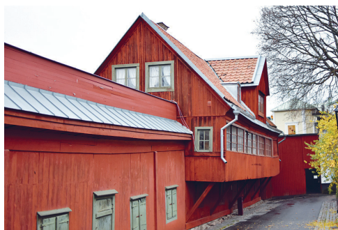
Bellmanshuset på Långa gatan.