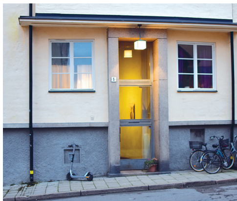
Andréegatan 5, där jag bodde från att jag var åtta år tills jag fyllde tjuugo.

till den plats varifrån jag har så många fina upplevelser från min uppväxt – Djurgårdsstaden. ☺