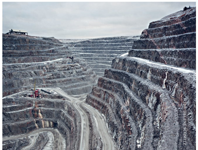
Helene Schmitz: Extractions . 2017. Inkjet on archival fine art paper, 150 x 193 cm.

Utställningen varar till 17 februari 2019.