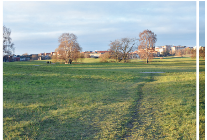
Ladugårdsgärde sett söderifrån med det stora fält som stadens joggare, skidåkare och hundar älskar. I horisonten till höger syns fältets fortsättning upp mot Gärdes bebyggelse.