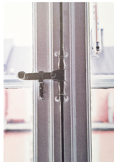
Spanjolett i förnicklad mässing från 1920-talet.

Strömställare med självlysande brytare blev ett signum för miljonprogrambebyggelsen. Den genomskinliga plastskivan skyddade tapeten.