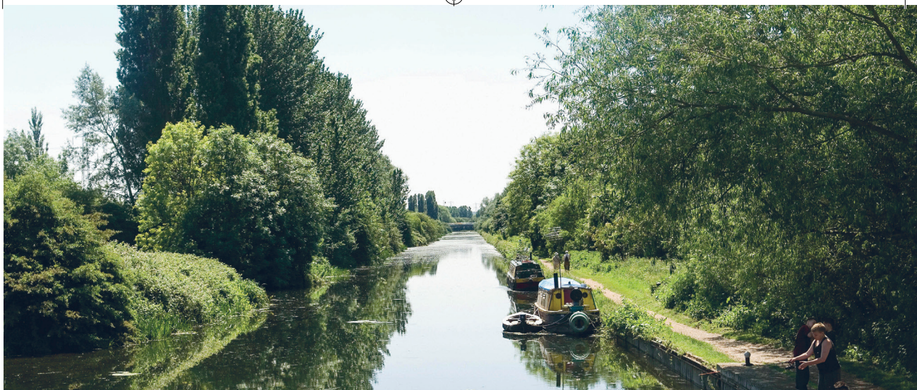
River Lee Country Park , är del av Londons 40 kvadratkilometer stora Lee Valley Regional Park , som nämns i kapitlet Quality of Life .

seförmåga och uppmärksamhet, framkallar positiva känslor, blockerar eller minskar plågsamma tankar och främjar återhämtning från oro och stress.