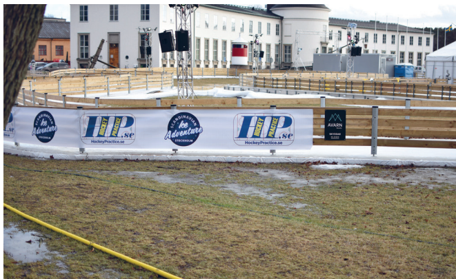
Bilden på anläggningen togs i februari.