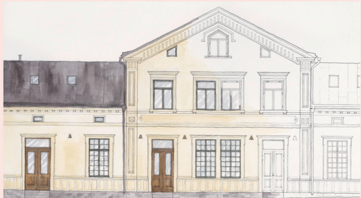
Skissen föreställer återskapandet fasaden från sommarpaviljongens invigning 1928.