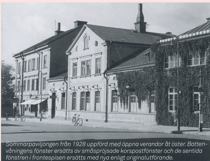
Sommarpaviljongen från 1928 uppförd med öppna verandor åt öster. Botten-våningens fönster ersätts av småspröjsade korspostfönster och de sentida fönstren i frontespisen ersätts med nya enligt originalutförande.

En del av byggnaden kommer att inhysa butiksverksamhet. Hör gärna av dig till oss med önskemål om vad som ska finnas i butiken till press@pophouse.se . Tack på förhand!