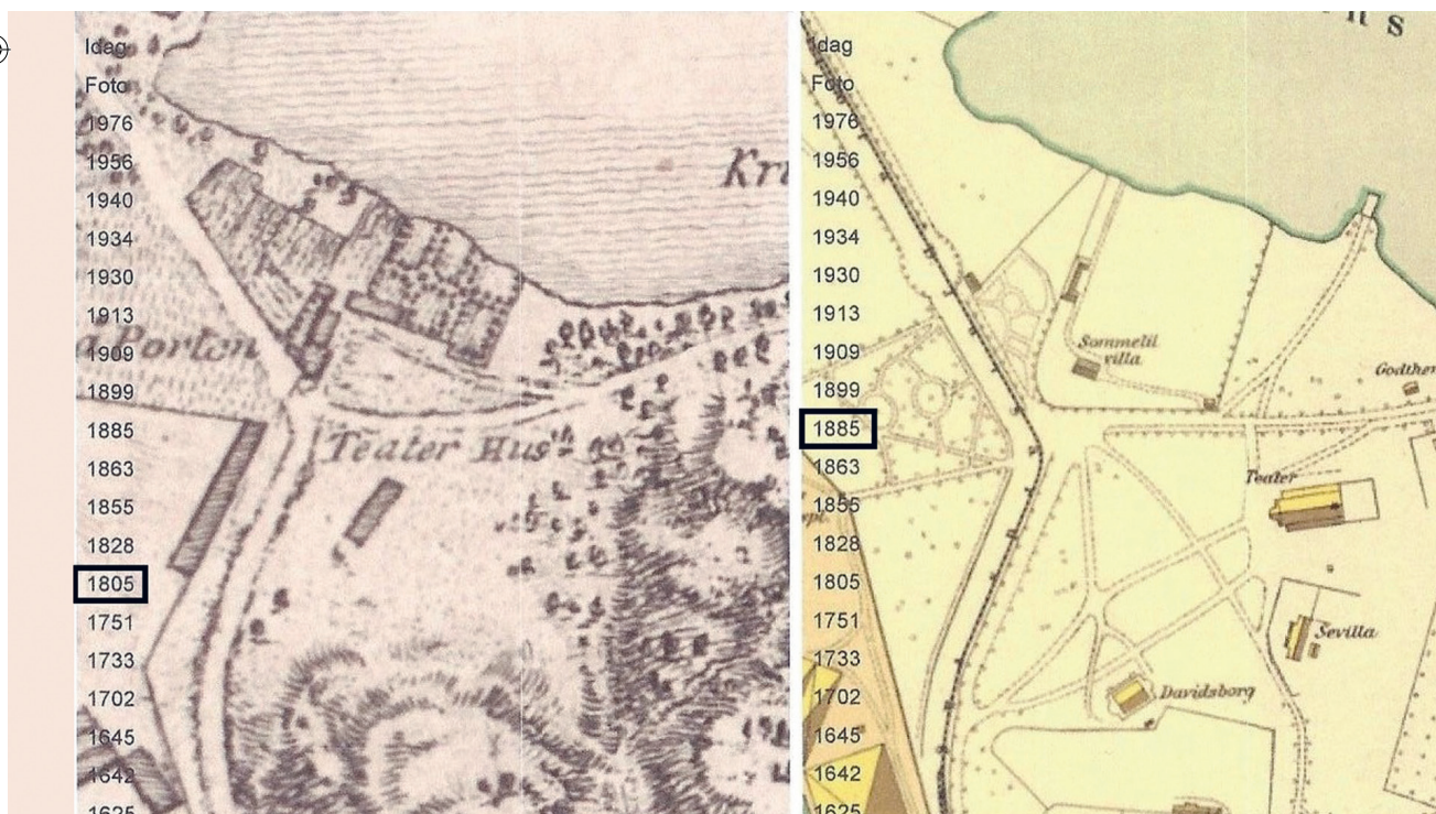
Första teaterns placering 1805 (tv) och andra teaterns placering 1885 (th).