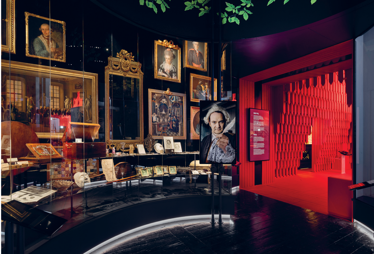
Detalj ur Nordbor på Nordiska museet; Tryckeriet, 1700-tal.