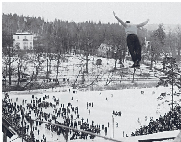
Backhoppning i Stora backen på Fiskartorpet 1935.