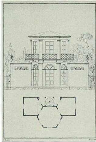
Modulhus av Fredrik Blom 1820. Med stor sannolikhet det första Oakhill.