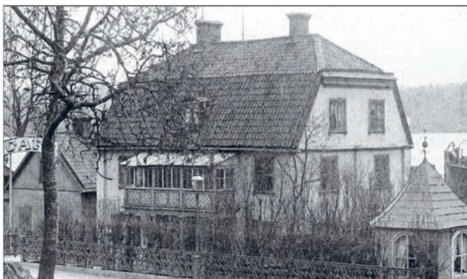
Till vänster Beckholmsbron 1890. Till höger Alberget 4A med skylten "Café", cirka 1892.