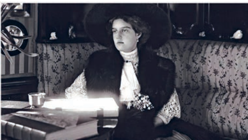
Maria Pavlovna i hemmet Oakhill.